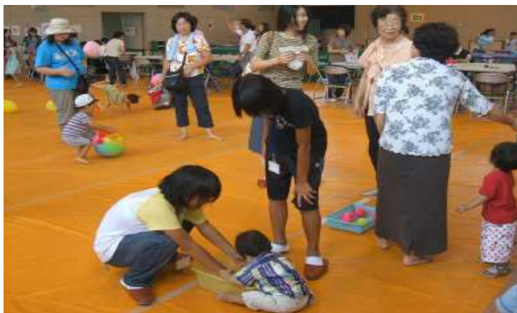
幼児から高齢者までの三世代交流会に ボランティアの中学生が参画 〔地域のシルバー＆チャイルドまつり〕