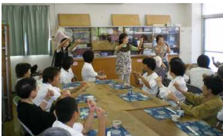
高齢者とボランティアの 中学生との交流 〔地域の敬老行事(土曜サロン)〕