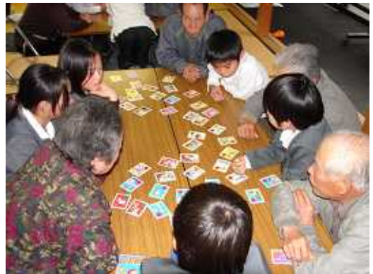
小学生と高齢者とのふれあい交流