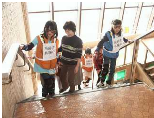
アイマスクによる体験活動