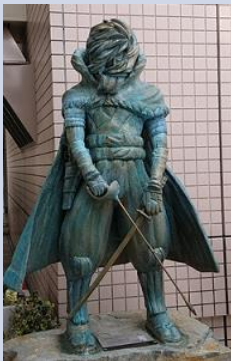
「宮本武蔵」×「キャプテンハーロック」