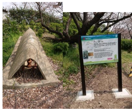
【道明寺天満宮 埴輪製作の登り窯(復元)】