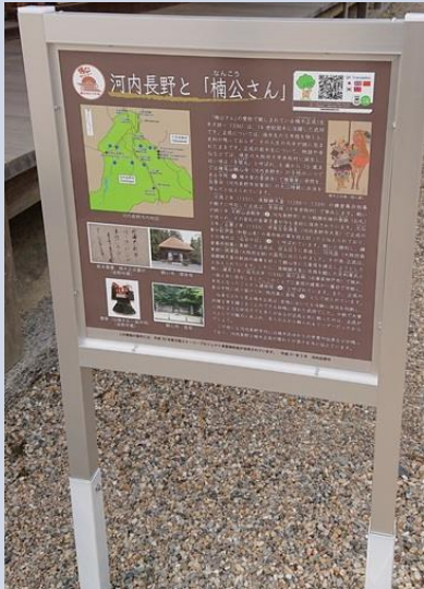
※QRコードによる多言語対応 (日、英、簡体、繁体、韓)