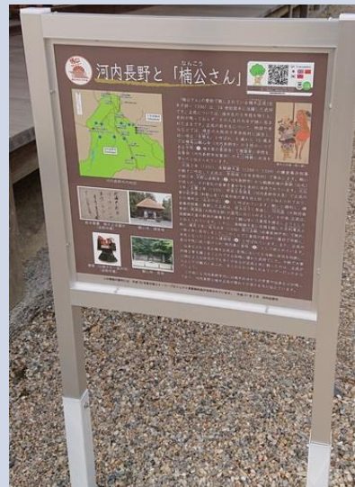
※QRコードによる多言語対応 (日、英、簡体、繁体、韓)