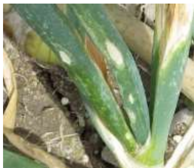
えそ条斑病の症状※