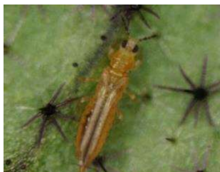
ミナミキイロアザミウマ成虫※