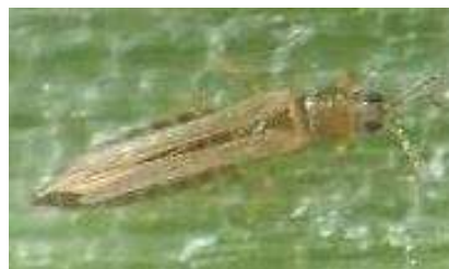
ネギアザミウマの成虫