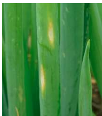
えそ条斑病の葉の病斑