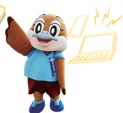
大阪府 広報担当副知事 もずやん

このため、発信者一人ひとりがモラルと人権意識を高め、自らが発信する内容に自己責任をもつ姿勢が大切です。