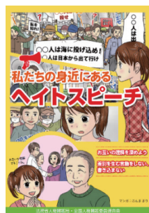
啓発冊子 私たちの身近にある ヘイトスピーチ

※詳しくは、法務省ホームページ「ヘイトスピーチ 許さない。」 http://www.moj.go.jp/JINKEN/jinken04_00108.html