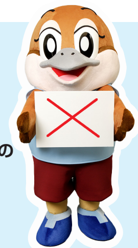
大阪府 広報担当副知事 もずやん

などは、それを見聞きした方々に、悲しみや恐怖、絶望感などを抱かせるものであり、決してあってはならないものです。(参考：法務省ホームページ「ヘイトスピーチに焦点を当てた啓発活動」)