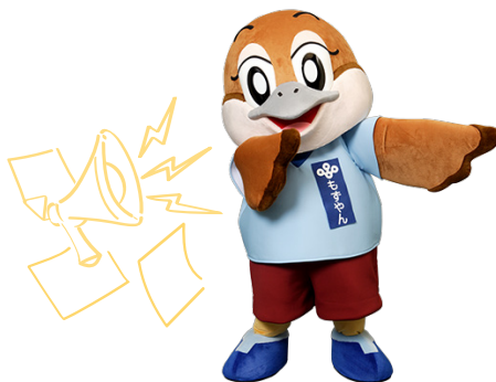
大阪府 広報担当副知事 もずやん