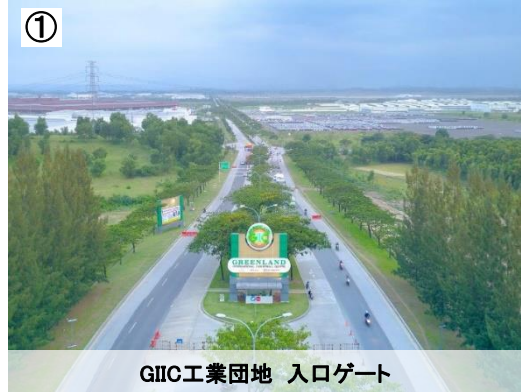
GIIC工業団地 入口ゲート