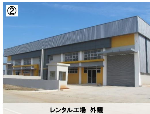
レンタル工場 外観