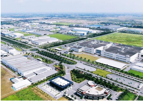
(第二タンロン工業団地)