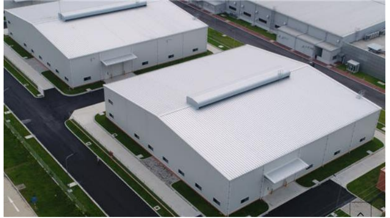
(レンタル工場外観)