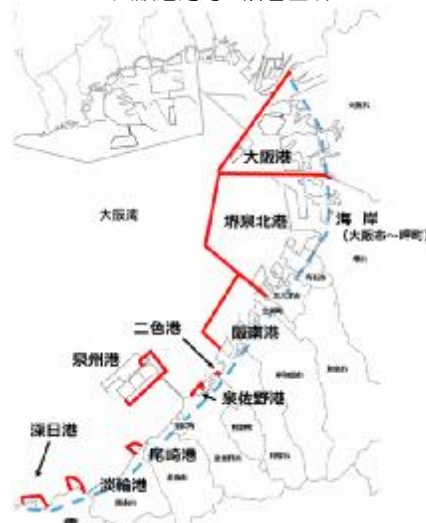
大阪港湾局の所管区域