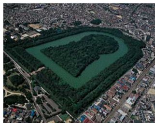
【世界文化遺産「百舌鳥・古市古墳群」】

府域の多様な観光素材を活かし、大阪府域全体へのクルーズ客船の乗客の訪問促進、クルーズ客船寄港による観光振興・地域活性化を図ります。