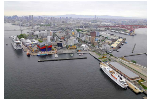
【中央突堤北岸壁(手前)】