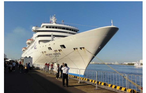
【堺泉北港大浜埠頭第5号岸壁】