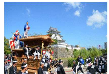
【岸和田だんじり祭】