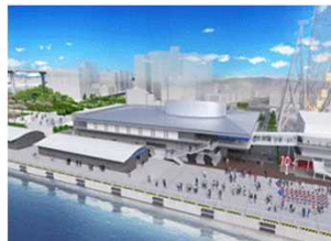
【新ターミナルのイメージ図】