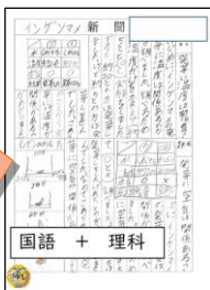
教科横断の取組み

ポイント 理科で学習した単元のまとめについて、国語で学んだまとめ方をいかして書く。