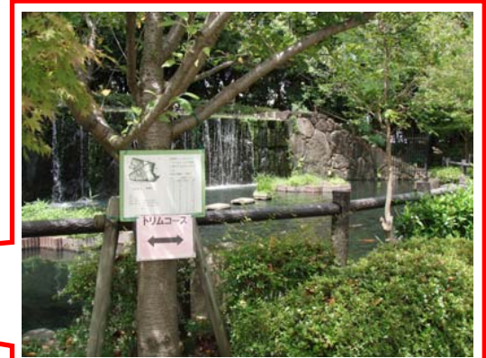
コース内のせせらぎには滝が流れています