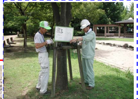
職員の手による手作り看板を設置して、これで今どこにいるか一目瞭然です