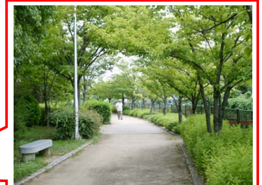
木立の中をのんびり歩けます