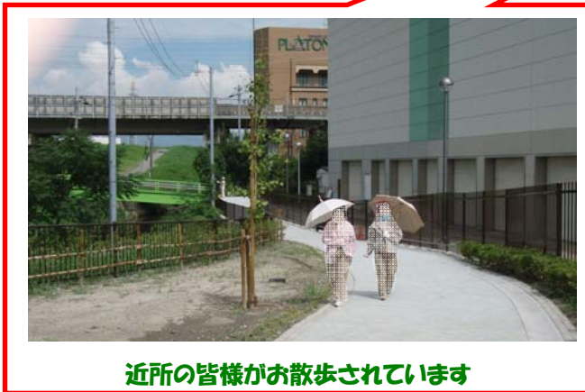
近所の皆様がお散歩されています