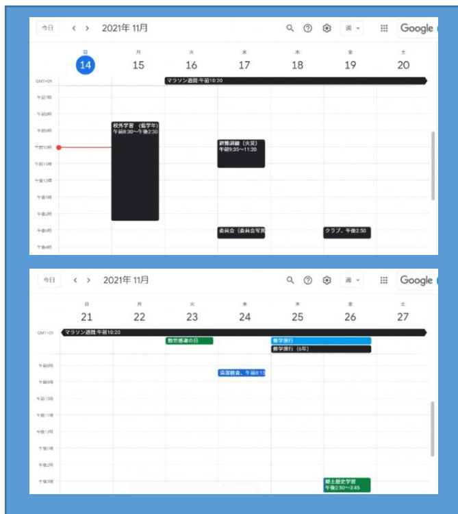
カレンダー全体の画面