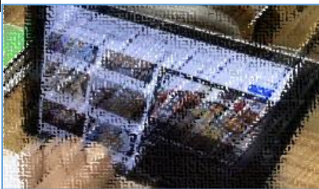
写真1：シベリアの食事を調べている場面