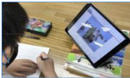
写真2：教科書以外で自分が知りたいことを調べ、ノートにまとめている場面