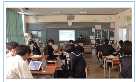
【写真3】作成中のスライドを全体で共有し、内容の確認を行っている場面