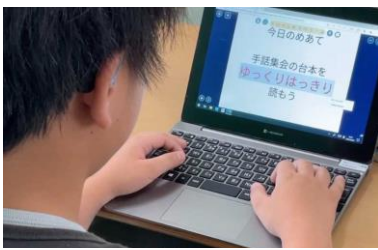
【写真1】本時のめあてを自分で書き加え設定している場面