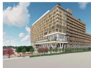
森之宮キャンパスの完成イメージ