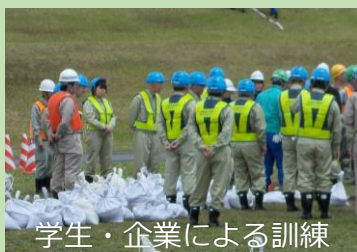
学生・企業による訓練